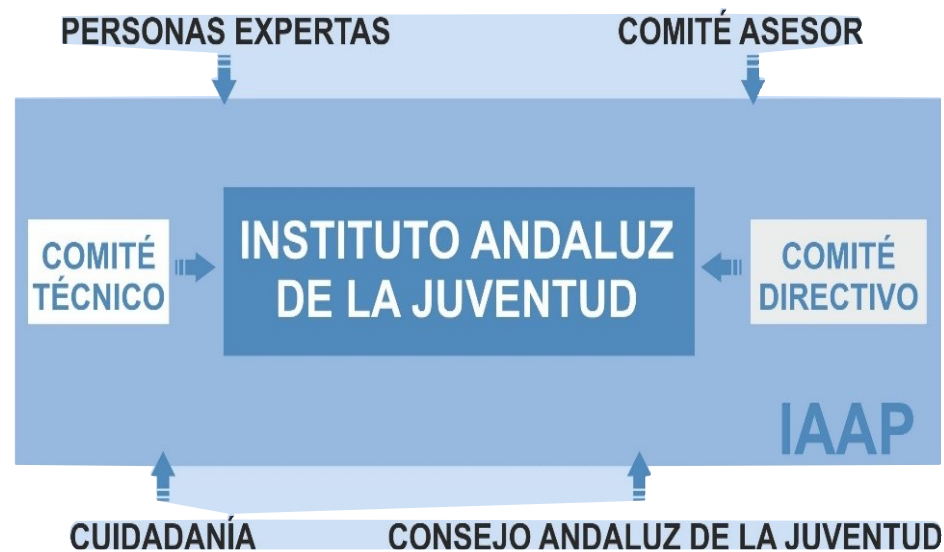
Figura 1. Agentes de la Gobernanza del PEJA

La elaboración de la Estrategia de la Juventud en Andalucía ha seguido un esquema de gobernanza participativa , tanto a nivel interno como a nivel externo. Con ello quiere decirse que este proceso ha supuesto, por un lado, la participación de todas las Consejerías de la Administración de la Junta de Andalucía en el proceso de formulación, para el análisis y aportación de propuestas y diseño de programas y medidas y, por otro, la realización de consultas a jóvenes y agentes implicados en las actuaciones dirigidas a jóvenes, para que participen en la toma de decisiones sobre los temas que les afectan, contribuyendo, así, a promover la participación de la juventud en la vida democrática.