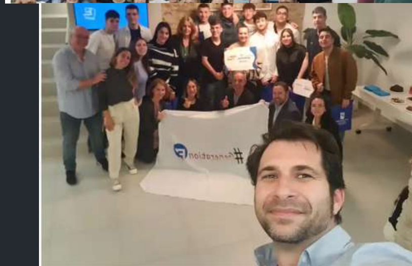
Un selfie de los participantes y organizadores del programa.