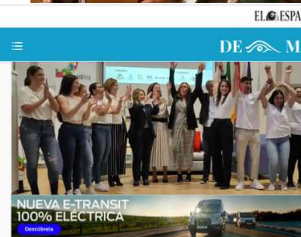
Los ganadores del concurso empresarial.