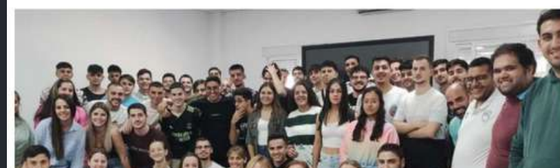
Un evento organizado por el Gobierno regional, CaixaBank Dualiza y FP Innovación

• El proyecto se basa en que los estudiantes han de presentar ante un jurado su idea de proyecto empresarial